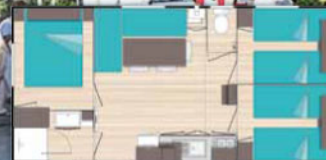
O'Phéa 784 B (7,80m x 4,00m)

De 2 à 5 personnes • 1 chambre lit 2 personnes • 1 chambre avec 1 lit superposé 2 du 3 personnes