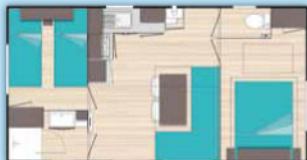
O'Phéa 734 (7,20m x 4,00m)

De 2 à 4 personnes • 1 chambre lit 2 personnes • 1 chambre 2 lits 1 personne