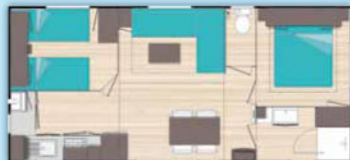
O'Phéa 834 (8,15m x 4,00m)

De 2 à 4 personnes • 1 chambre lit 2 personnes • 1 chambre 2 lits 1 personne